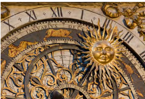
Horloge astronomique de la cathédrale Saint Jean-Baptiste à Lyon.

Mais pourquoi donc février est-il plus court que les autres mois ?