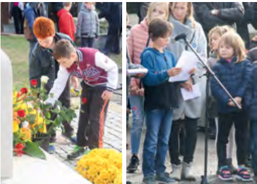
Les élèves de CM2 déposent des roses blanches et rouges à l'appel des 7 soldats morts en 1918.