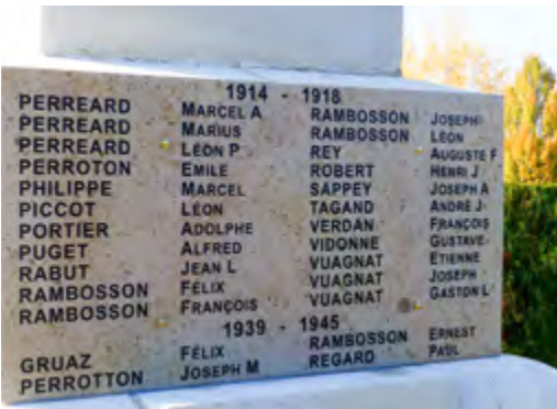
À l'occasion du centenaire, de nouvelles plaques de marbre ont été mises en place sur le Monument aux morts.