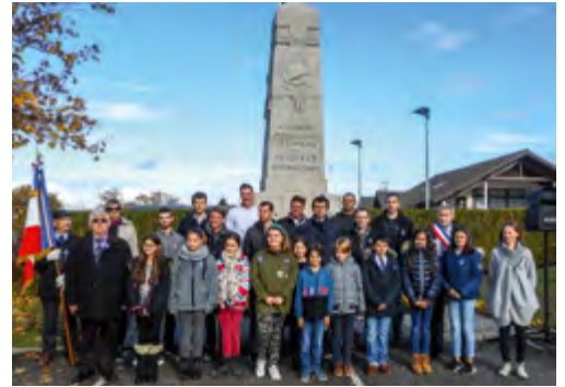
Les protagonistes de la Cérémonie