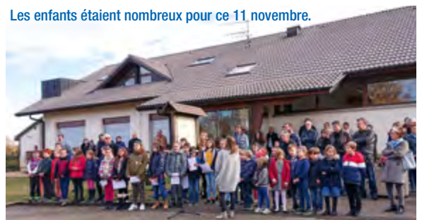
Les enfants étaient nombreux pour ce 11 novembre.

À l'approche des fêtes de Noël et de fin d'année, moment de convivialité, de partage et d'harmonie, je me vois frappé d'accusation grave à mon encontre, dont deux plaintes pour lesquelles je suis entendu à la gendarmerie.