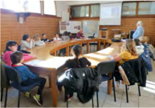
Les élèves de CM2 durant la préparation de la cérémonie.