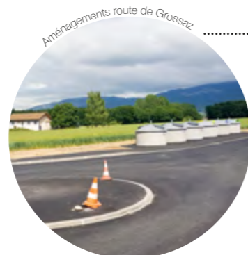
Aménagements route de Grossaz