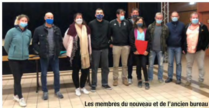
Les membres du nouveau et de l'ancien bureau